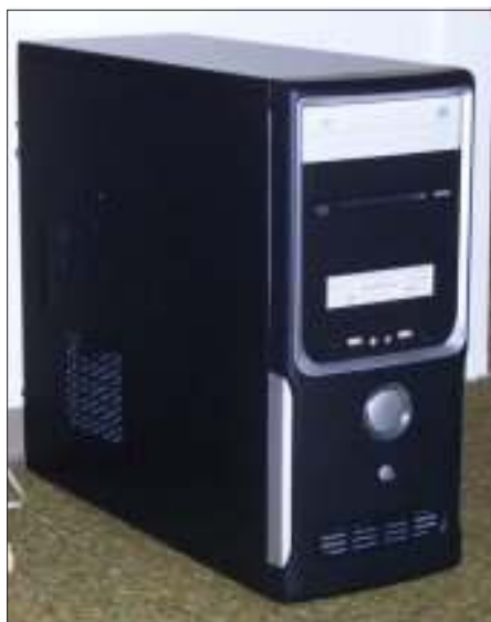
Das gute Stück!

Laut Gesetz sind wir verpflichtet, diese Gegendarstellung zu veröffentlichen. Die Redaktion bedauert, falschen Informationen geglaubt zu haben.